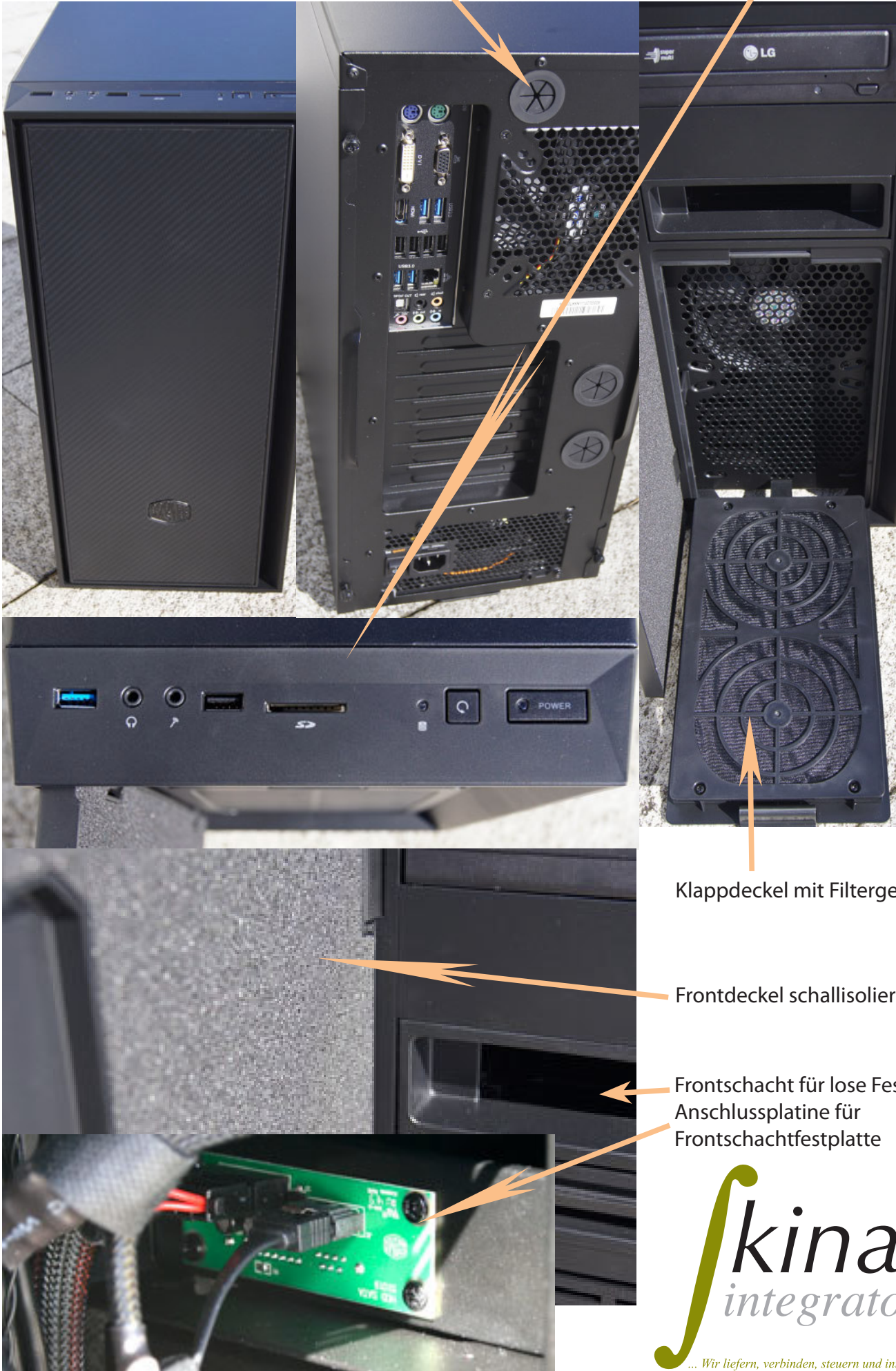
Klappdeckel mit Filtergewebe

Schlichtes Design in schwarz - vorinstallierte Kabeldurchführungen - Front USB-SD-Anschluss